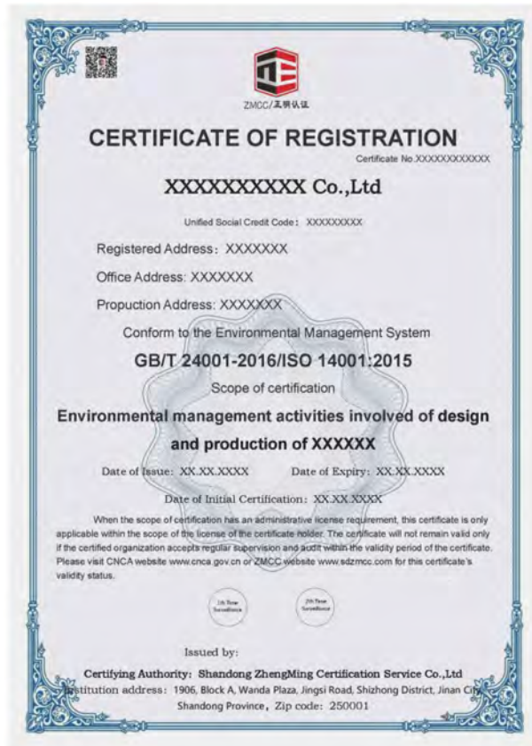
2) 环境管理体系认证证书样本（中文、英文）