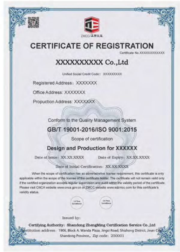
1) 质量管理体系认证证书样本（中文、英文）