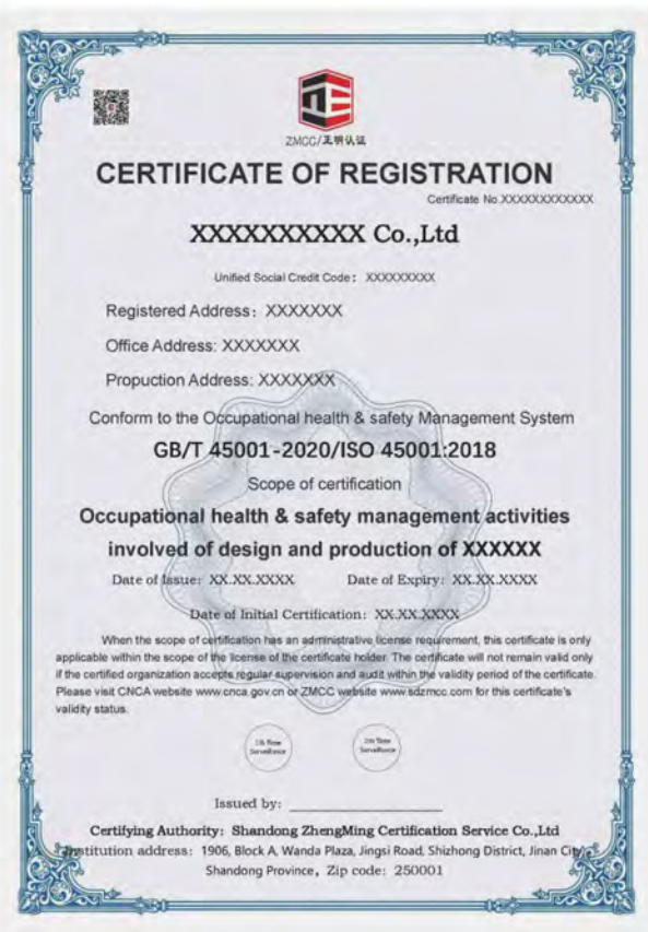
3) 职业健康安全管理体系认证证书样本（中文、英文）